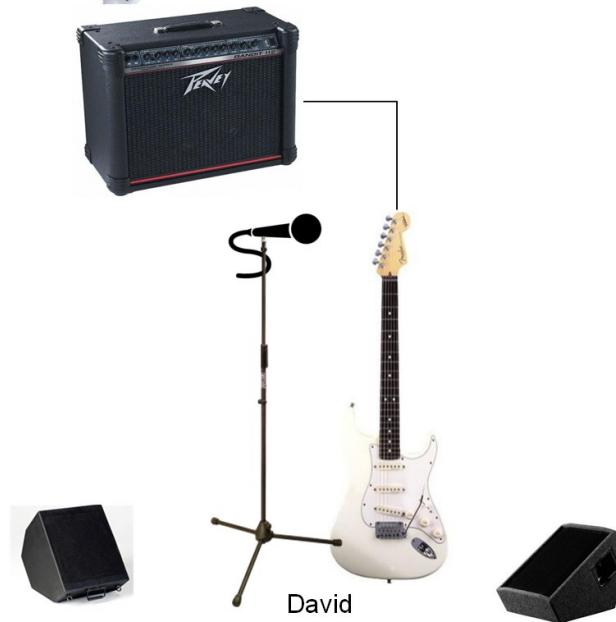
David Guitare 2 Chant 1